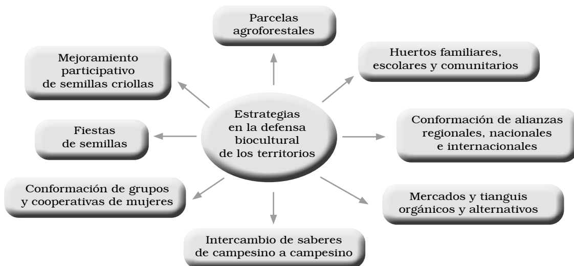
Figura 1. Estrategias para la defensa biocultural de los territorios