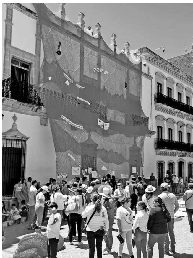
Instalación Sangre de mi Sangre, durante marcha del 10 de mayo de 2023.