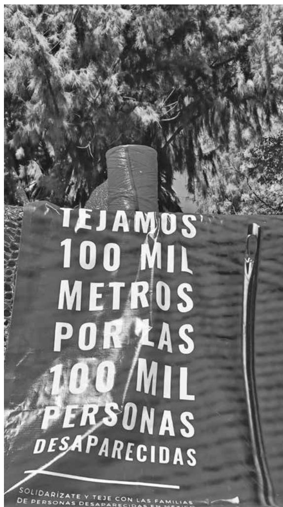
Invitación a tejer en el proyecto Sangre de mi Sangre.