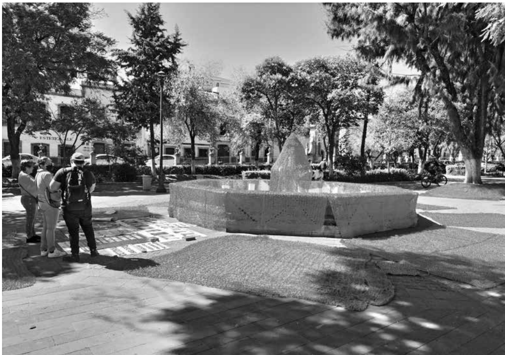
Alameda de Zacatecas, noviembre de 2022.