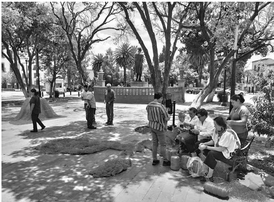
Madres y familiares de desaparecidos tejendo, en el fondo cubierto el monumento de Francisco García Salinas.

más personas a las que les preocupa su falta [...] porque cuando vamos donde las autoridades lo que nos dicen es que nos olvidemos de que lo vamos a encontrar [Madre 1, testimonio, mayo de 2023]. 4