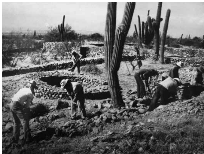
Foto 1. Trabajadores realizando las tareas de reconstrucción, mayo de 1978.

Ahora bien, durante la primera etapa, el delegado comunal seleccionó personalmente a los obreros y además se ocupó de cuestiones de logística como el traslado de los trabajadores de las localidades de Colalao del Valle y El Pichao al sitio, el aprovisionamiento