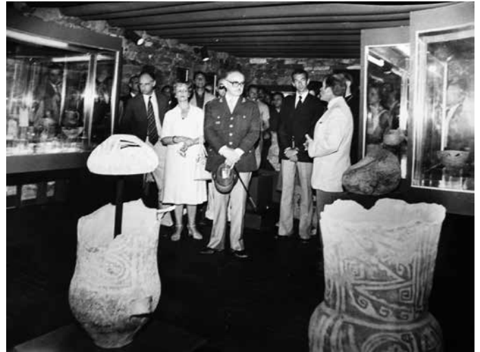
Foto 2. Inauguración del museo de sitio, diciembre de 1980.

Además, entendemos que existió tensión entre el delegado comunal y el arqueólogo. El primero era el responsable en la fase inicial de las tareas y poseía un interés personal en temas arqueológicos e históricos. Con la llegada del arqueólogo designado por la provincia, las acciones del delegado se vieron reducidas. El desplazamiento del poder del delegado puede apreciarse en tres aspectos: la organización de las tareas, ya que su función se redujo exclusivamente al pago de los salarios desde su puesto de delegado comunal; la iniciativa intelectual del proyecto, pues se desconocen sus gestiones con los “especialistas”