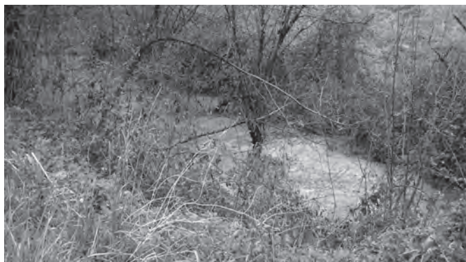
Balsa ilegal de purines camuflada entre las zarzas, a pocos metros del río Las Escaleras. Es una de las consecuencias medioambientales más graves del modelo de intensificación.