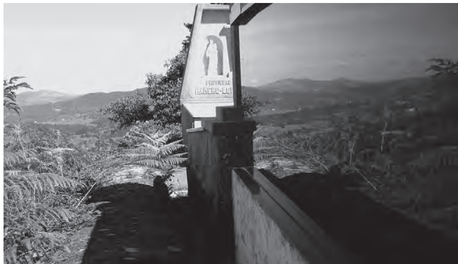
Este cementerio nos devuelve una metáfora: el paisaje construyéndose entre la acción cotidiana, la emoción de saberse en un entorno conocido y arraigado y la memoria del paisaje, del pueblo y la familia.