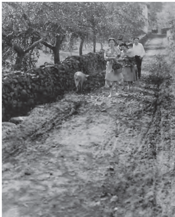
Aspecto estrecho y embarrado del camino de “La Ranchada” a mitad del siglo xx. Los trayectos a pie y los animales sueltos formaban parte de la vida cotidiana del Valle.