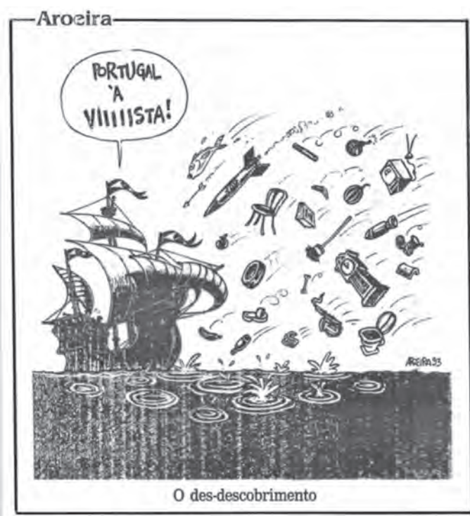
Figura 1 Drama familiar

New Bedford y São Paulo y las más recientes migraciones de brasileños a Lisboa. 7 Si al principio mi investigación en New Bedford había focalizado las aparentes paradojas desencadenadas por el drama de la violación en banda y la construcción de la saudade en una ciudad americana y sus desdoblamientos, la contrastación lusobrasileña estuvo basada operativamente en otros dos sucesos. Con uno de ellos busqué descifrar las paradojas y contradicciones de las relaciones lusobrasileñas centrándome en la eclosión de conflictos diplomáticos entre Portugal y Brasil en 1993, cuando brasileños de los estratos socioeconómicos más bajos, junto con ciudadanos de los Países Africanos de Lengua Oficial Portuguesa (PALOP), comenzaron a ser detenidos en el aeropuerto de Lisboa por el Servicio de Extranjeros y Fronteras (SEF). Esta situación, que trajo a la luz reinterpretaciones de la dupla historia colonial y de inmigración portuguesa en Brasil, fue representada como un drama familiar por los medios brasileños, según puede apreciarse en la figura 1.