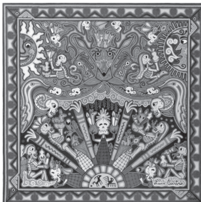
“Sin título”, de Luis Casto, Galería Colectika, Puerto Vallarta, 2011