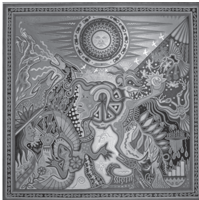
“Sin título”, de Neikame, Galería Colectika, Puerto Vallarta, 2011