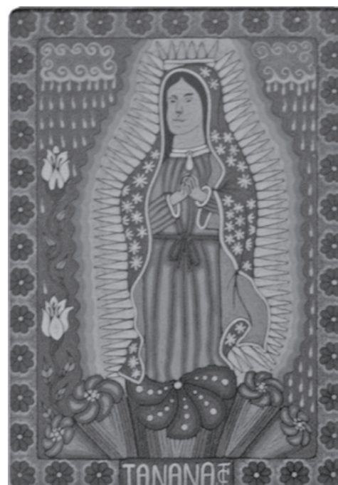
Tanana , de Juan Carrillo, La Selva Café, Guadalajara, 2012