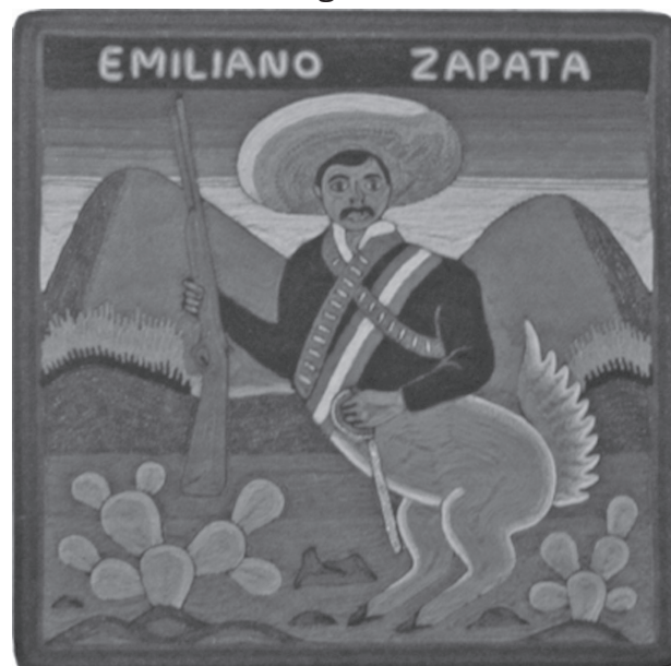
Zapata , de Lucas Matzuwa Castro Jiménez, La Selva Café, Guadalajara, 2012